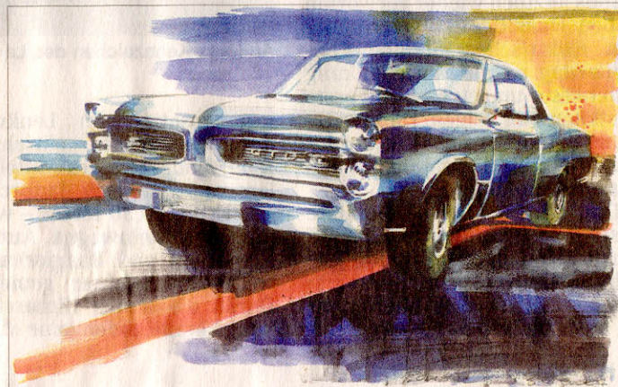
Aquarell von Klaus Bergner in der Größe 50 mal 60 Zentimeter von einem Pontiac GTO aus dem Jahr 1966.