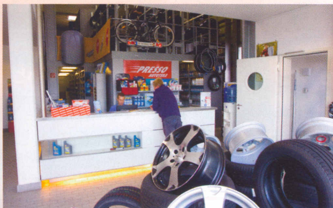
Bis 20 Uhr geöffnet: Verkaufsraum mit Lager im Hintergrund.