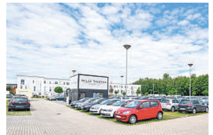
Auf dem Gelände von Willy Tiedtke finden die Besucher zusätzlich zur Fahrzeugausstellung während des Wentorfer Herbstes etliche weitere Attraktionen.

Doch das ist längst nicht alles am 17. September: Besonders für Kinder und Jugendliche gibt es wieder das beliebte Bungee-Trampolin, das von geschultem Personal beaufsichtigt wird. Für die großen Besucher werden in einer Piaggio Ape leckere italienische Kaffeespezialitäten ausgeteilt. Und sie können sich über das Angebot an Gebrauchten informieren, das mehr als 200 Fahrzeuge umfasst. Das Team von Willy Tiedtke steht für alle Fragen zur Verfügung.