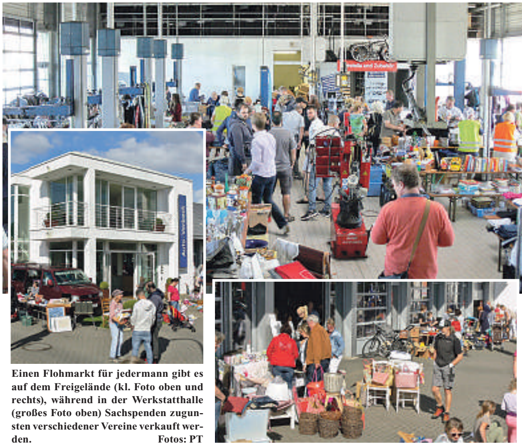
Einen Flohmarkt für jedermann gibt es auf dem Freigelände (kl. Foto oben und rechts), während in der Werkstatthalle (großes Foto oben) Sachspenden zugunsten verschiedener Vereine verkauft werden.

Bei Auto-Vorbeck am Südreder in Wentorf startet am Sonntag, 17. September, 11 Uhr, der Wentorfer Spenden- und Flohmarkt. Nach dem großen Erfolg in den vergangenen Jahren wird die Idee des Spendenmarktes mit drei Vereinen aus der Region weitergeführt.