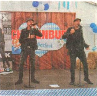
Das Duo „Die Junx“ sorgte im Festzelt bei Schulenburg für phantastische Stimmung.