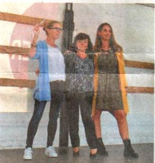
Den neuesten Chic für den Herbst präsentierte das Modehaus „anabanda“ im Casinopark.

Wentorfer Geschäftsleute organisierten verkaufsoffenen Sonntag